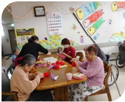
母の日に思いを寄せてカーネーションを作りました。