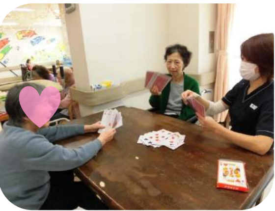
ばばぬきに挑戦！ ばばを持っているのは誰？